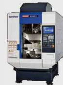
旋削付マシニングセンタ M140X2