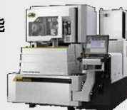
リニアモータ駆動高性能 ワイヤー放電加工機 ALN400G