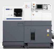
主軸台移動形CNC自動盤 Cincom L20IX