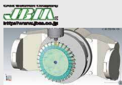
(株)ジェービーエム