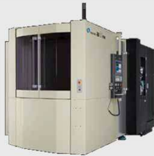
横型マシニングセンタ a51nx