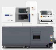
主軸台移動形CNC自動盤 Cincom L12