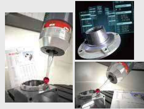
フォームコントロール タッチプローブ レーザー測長機