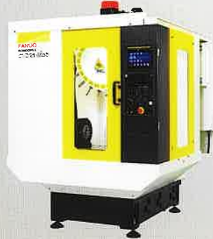
ファナック(株) ①小型切削加工機 α-D14MiB5 ②ワイヤカット放電加工機 ROBOCUT α-C600iB 削れる驚異の#30マシン!! 安定した自動結線。(板厚500mm水中結線可能です。)