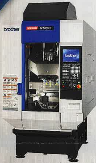
ブラザー工業(株) 旋削付マシニングセンタ M140×2 進化する工程集約マシン。 工程分けしているワークを 見直しませんか?