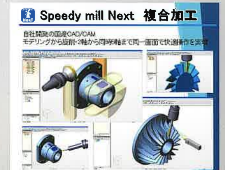
キャムタス(株) 日本のものづくりに適した自社開発ソフトウェア。 2次元、3次元統合 CAD/CAM“Speedy mill Next”

※一部写真と商品が異なる場合がございます。 ※都合により出展できない商品もございます。