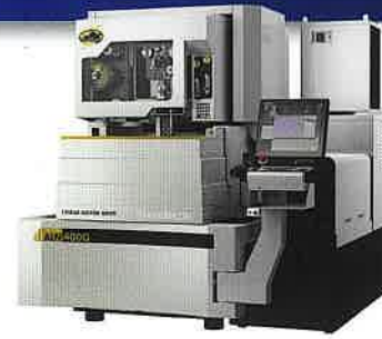
(株)ソディック リニアモータ駆動 高性能ファイヤ放電加工機 ALN400G 最新のタイコレス制御搭載や IoT対応の精密ファイヤ加工機。