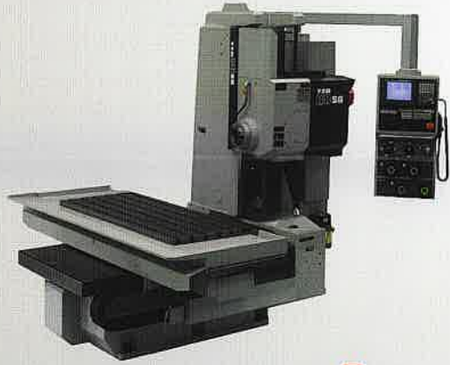
(株)山崎技研 横形CNCフライス盤 YZB-88SG 業界最小クラス!! 「横中=大型」というイメージをお持ちでは ありませんか? YZB-88SGは省スペースながらワイドな ストロークを確保。広い加工スペースで、 今まで大型機に頼っていた仕事も効率良く こなせます。