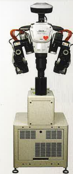
THK(株) NEXTAGE 人が行っている作業の代替えを目的に 作られた双腕型産業用ロボット。