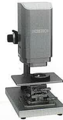
(株)東京精密 非接触三次元表面粗さ・ 形状測定機 Opt-scope “非接触”かつ“短時間”で ワーク形状の面全体を 三次元的に評価します。