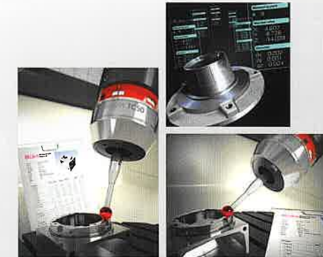
ブルーム・ノボテスト(株) フォームコントロール(コラボ展示) 機上でフォームコントロールにより輪郭形状を計測。 フォームコントロールは加工後の3次元測定機で NGとなる前に、機上であらかじめ確認が出来ます。