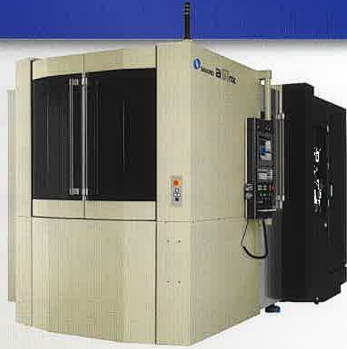
(株)牧野フライス製作所 横形マシニングセンタ a51nx 自動車部品や建設機械など量産部品は もとより、半導体製造装置、航空機等の 試作部品に最適。