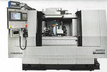
(株)岡本工作機械製作所 CNC精密複合研削盤 UGM360NC 3台を1台で。 円筒・内面・ロータリー研削を ワンチャッキングで高精度加工。